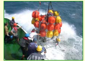
Ausbringen einer Meeresbodenstation